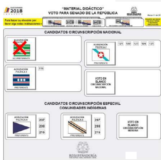
Voto no preferente